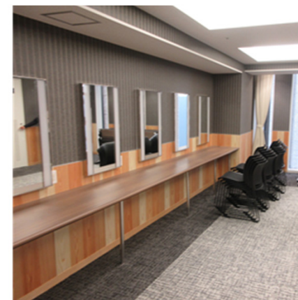
控室（2部屋 ※サイズ大小あり）

実施演目： セミナー・レクチャー、トークイベント等を実施。 スタジオではジオラマ、模型、商品等の展示。