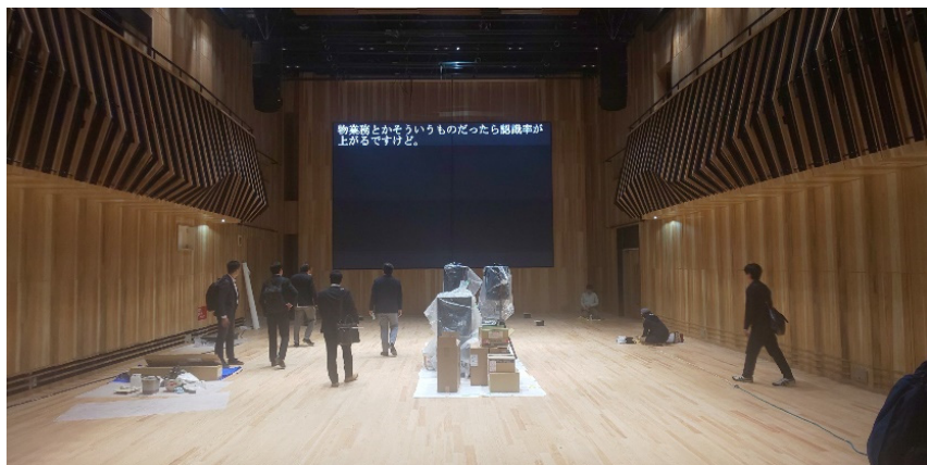
メインホール正面