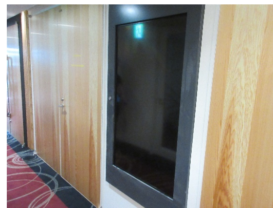
小ホール前サイネージ

実施演目： セミナー、表彰式、小型のイベント、学生とのワークショップ等、顧客との距離感が近いイベントの実施。