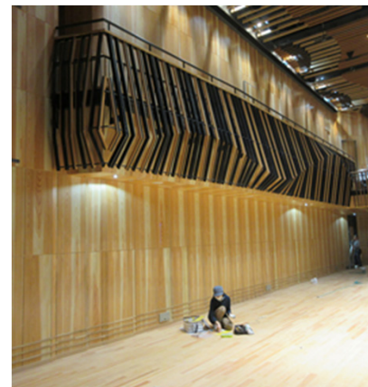
メインホール側面