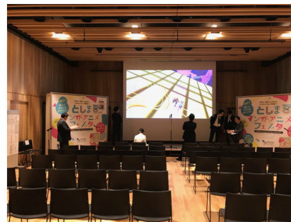
小ホール（利用イメージ）